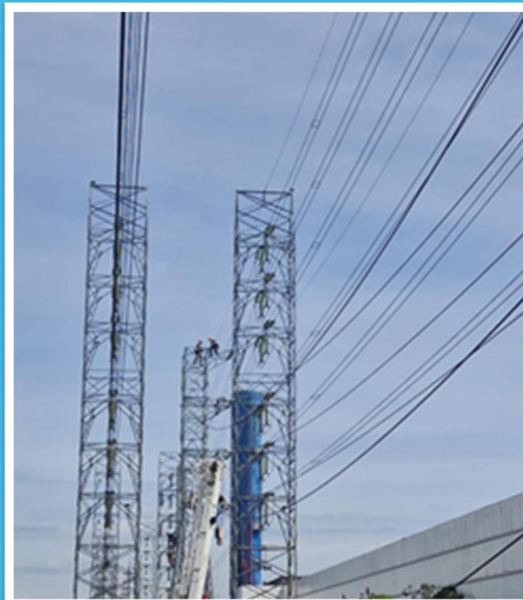
EOC Central Plaza